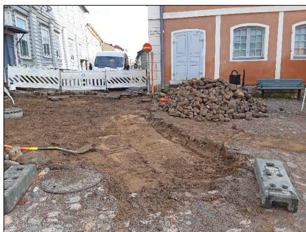
Valmiiksi kaivettu A2 itään (vas.) ja kaakkoon (oik.) kuvattuna.