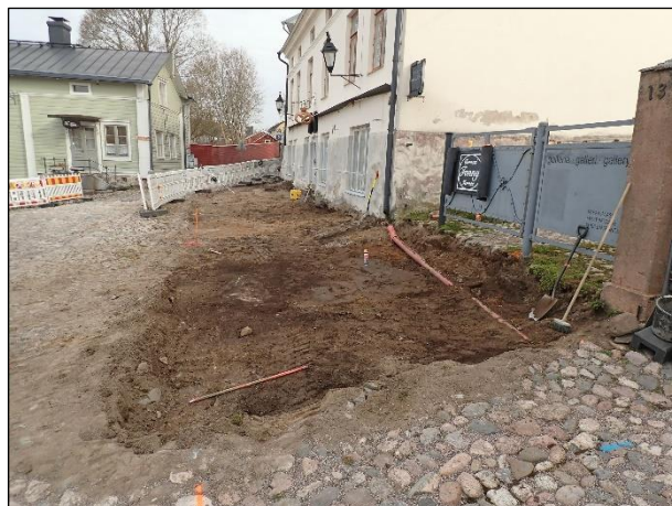
Valmiiksi kaivetun A1:n koillisempi puolikas kaakkoon (vas.) ja luoteeseen (oik.) kuvattuna.