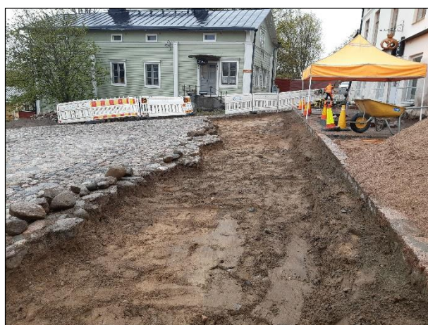
Valmiiksi kaivetun A1:n lounaisempi puolikas kaakkoon (vas.) ja luoteeseen (oik.) kuvattuna.