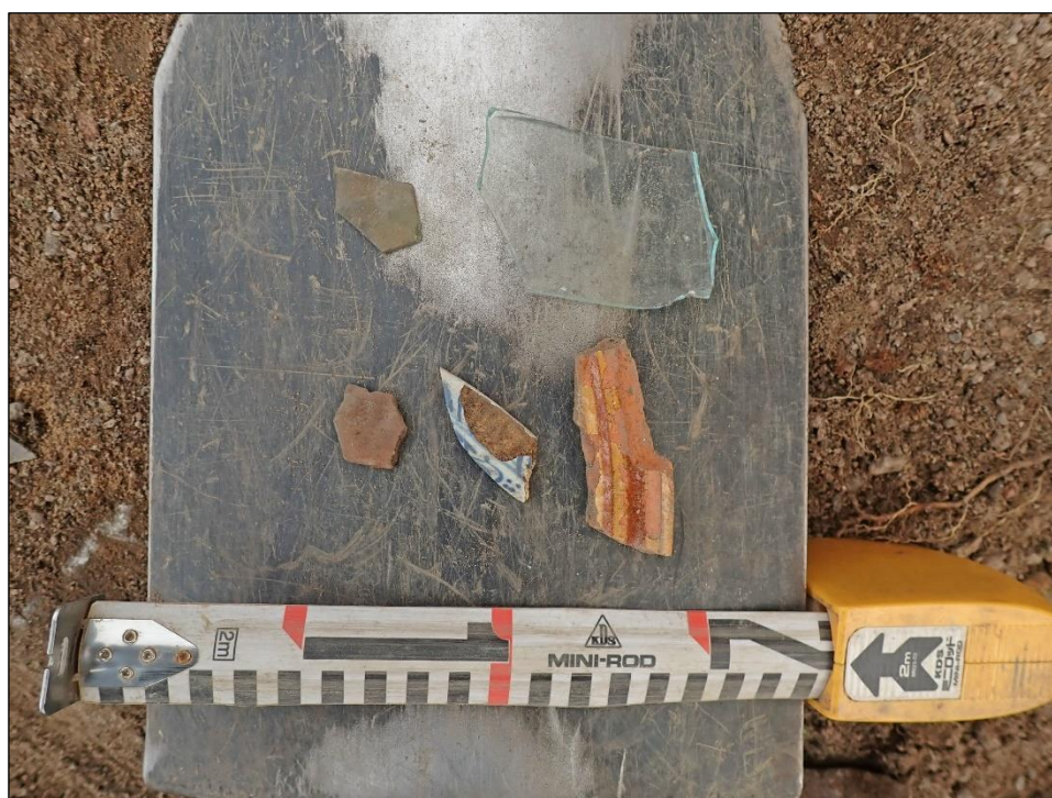
Kappalaisentalon juuren tummasta maasta tulleet löydöt: 1 sirpale sameaa ja 1 sirpale kirkasta tasolasia, 1 pala lasitteetonta punasavikeramiikkaa tai kaakelia, 1 pala fajanssia ja 1 kappale boluskoristeltua punasavikeramiikkaa.