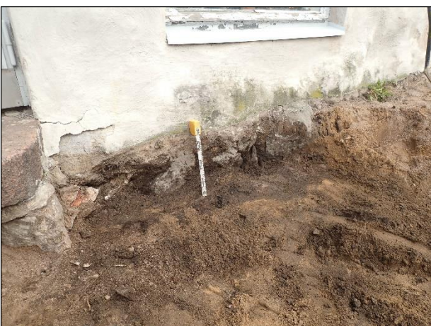
Tummaa tiilimurskankeskaista maata Kappalaisentalon juurella.