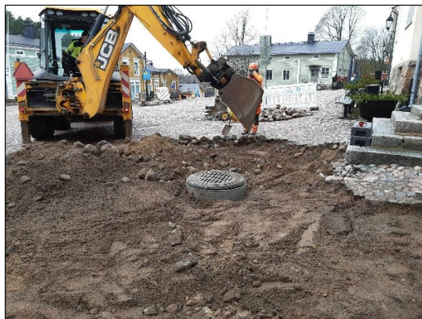
Vasemmalla: A2 ennen kaivun aloittamista. Kuvattu kaakkoon. Oikealla: A2:n mukulakiviä poistetaan. Kuvattu luoteeseen.